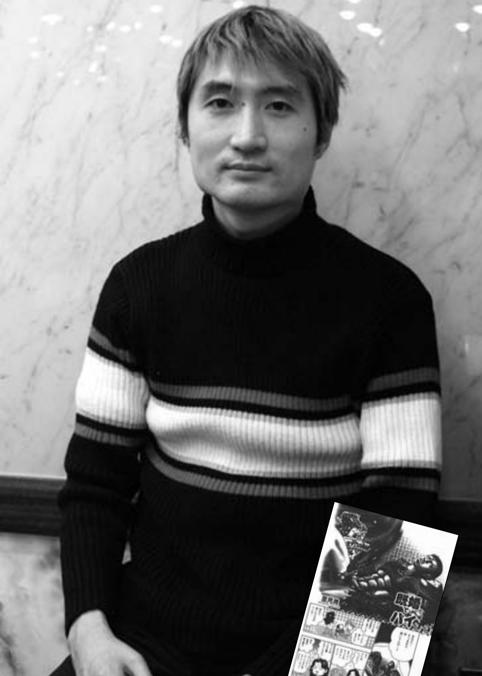
「既婚でバイ」 「バディ」4月号(テラ出版)収録